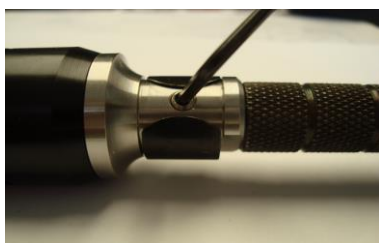
Bild 4 Arretierung des Schutzschlauches am Handstück mittels Schraube